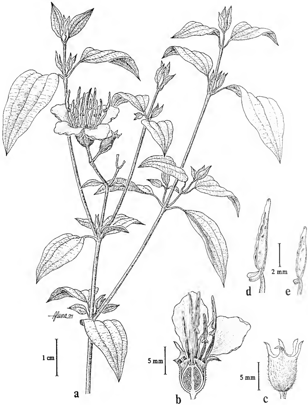
Fig. 2. Tibouchina scabriuscula . -A. Rama con inflorescencia. -B. Flor. -C. Sépalos sin seta terminal. -D. y -E. Estambres largo y corto con las prolongaciones del tejido conectivo.