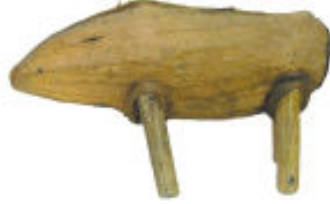
सुअर बन दौड़ी आम की गुठली